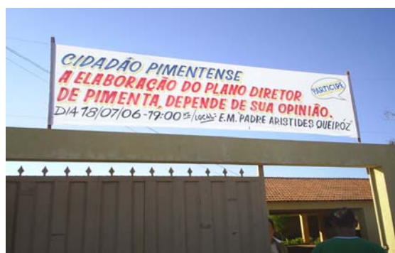
Figura 6: Divulgação Pública dos Pimenta