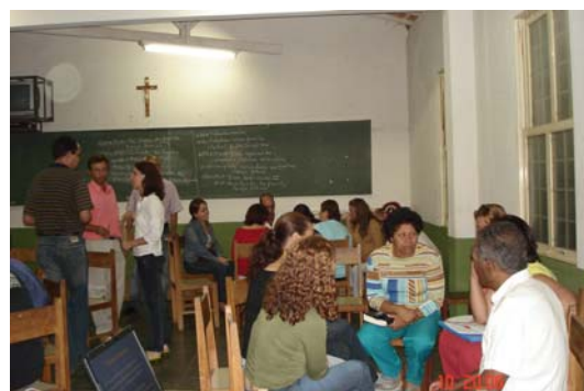
Figura 2: Leitura Comunitária Capitólio