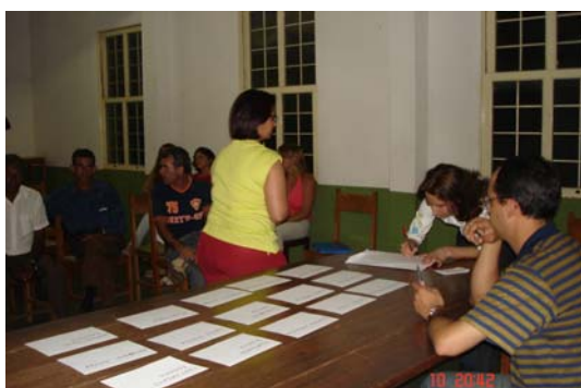
Figura 3: Leitura Comunitária Capitólio