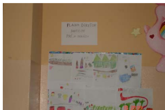
Figura 4: Material produzido por alunos em São J. da Barra