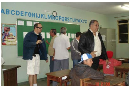
Figura 1: Leitura Comunitária Pimenta

nas diferentes áreas. Os descritores eram lidos pelo relator, seguido de debates e esclarecimentos, e colocado à vista de todos nas paredes da sala de trabalho. Ao final, depois de aprovado pelo grupo, os descritores eram recolhidos pela coordenação do Núcleo Gestor, digitados e sistematizados na respectiva ata da oficina.