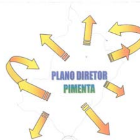
Figura 8: Divulgação Pública dos eventos

O que se quer realizar, precisa de busca e planejamento.